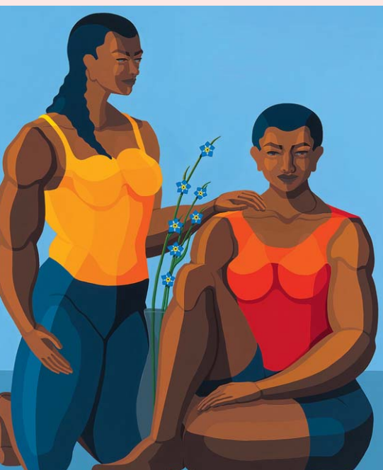
Nirit Takele, Memory's Touch (Acryl auf Leinwand, 2025)

Kunst, Musik und Design greifen dabei ineinander. Entstanden ist eine Ausstellung mit zeitgenössischen Kunstwerken, inter-