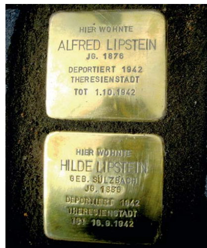
Abb. 4: Stolpersteine für Alfred und Hilde Lipstein