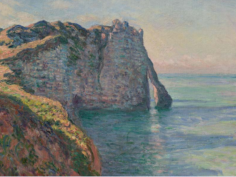
„Die Steilküste von Aval“ ist eins von 24 Gemälden von Claude Monet im Städel Frankfurt.

A uftakt ist ein sinnliches Erlebnis, in dem die Grenzen zwischen Realität und Simulation zu verschwimmen scheinen: Auf einem Klangteppich aus Meeresrauschen und kreischenden Möwen fliegt der Besucher die normannische Steilküste rund um den einstigen Fischerort Étretat entlang, vorbei an den drei spektakulären Felsentoren Porte d'Amont, Porte d'Aval und Manneporte. Möglich wird die visuelle und akustische Reise durch eine Videoinstallation – einen dreidimensionalen Scan im Entrée der Ausstellung „Monets Küste – Die Entdeckung von Étretat“ im Frankfurter Städel Museum.