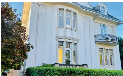
Neue Büros im Erdgeschoss einer Gründerzeitvilla, Baujahr um 1900.