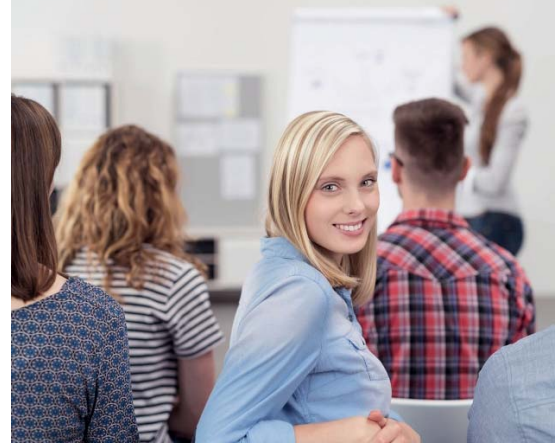
Jetzt als MFA höherqualifizieren!

Mit der Fortbildung „Fachwirt/-in für ambulante medizinische Versorgung“ bauen Medizinische Fachangestellte ihr Wissen aus und qualifizieren sich in den Bereichen Praxismanagement, Teamführung und Medizin. Ab 2024 bietet die Carl-Oelemann-Schule den höherqualifizierenden Lehrgang für MFA nach dem überarbeiteten Rahmencurriculum der Bundesärztekammer an. Das Curriculum und die Mus-